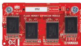
Flash-Speicher-Erweiterungsmodul FL512M / FL1024M