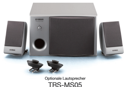
Optionale Lautsprecher TRS-MS05